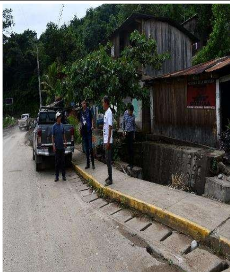
Aguas pluviales desembocan a lado del colegio.