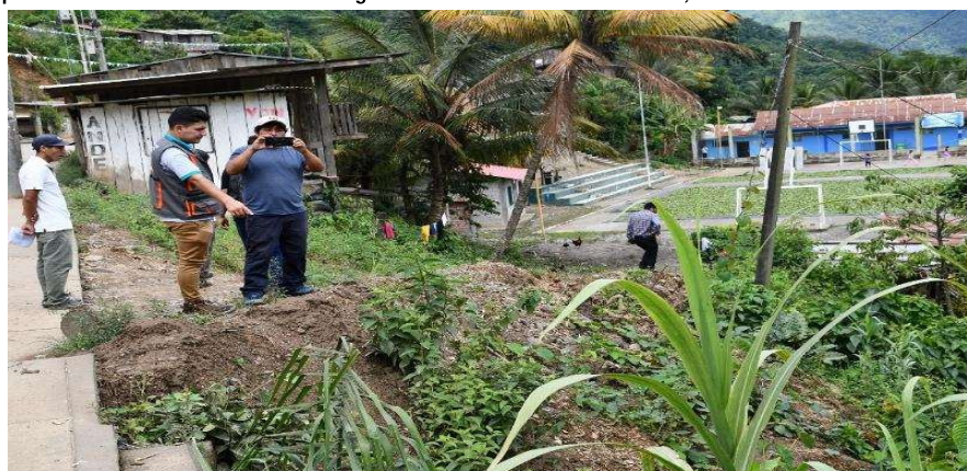
Institución educativa en peligro por afectación del río Chaquihuaycco