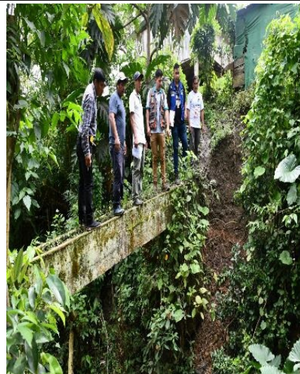
Taludes de río, vulnerable a erosión